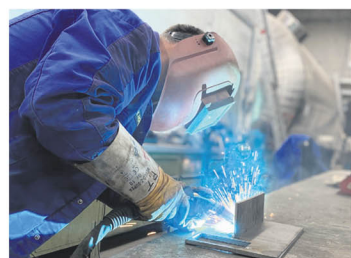
Knapp 200 Beschäftigte sind für RKM-Arens tätig.