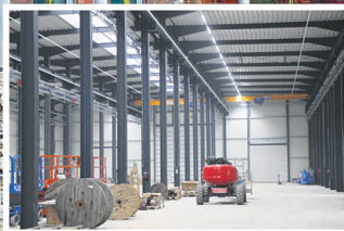
Das neue Bürogebäude von RKM-Arens Anlagenbau mit der Fertigungshalle, die in den kommenden Wochen in Betrieb genommen wird.